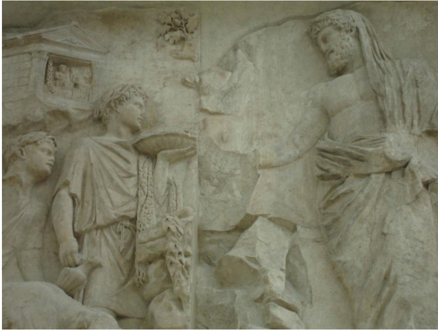
Figura 3. Eneas llega al Lacio. Panel derecho del lado oeste.