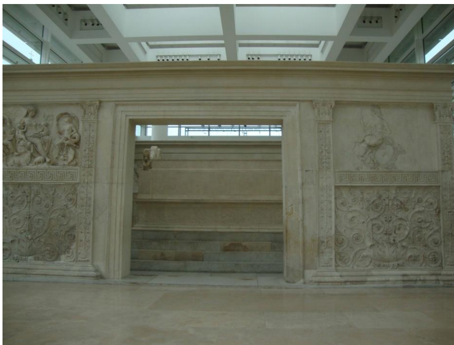
Figura 7. Lado este. A la izquierda representación de Tellus , a la derecha representación de Roma.