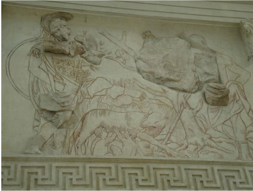
Figura 6. Lado oeste. Lupercalia.