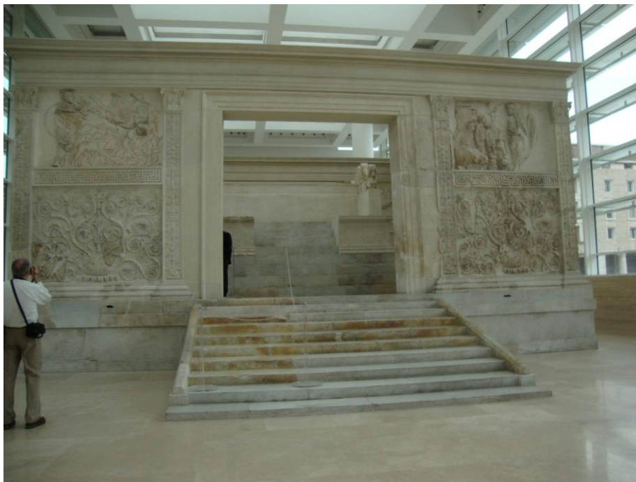
Figura 1. Lado oeste del altar.