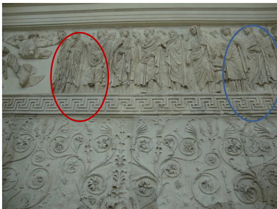
Figura 5. Lado sur: Augusto, lictores, sacerdotes, miembros de la familia real y dignatarios.