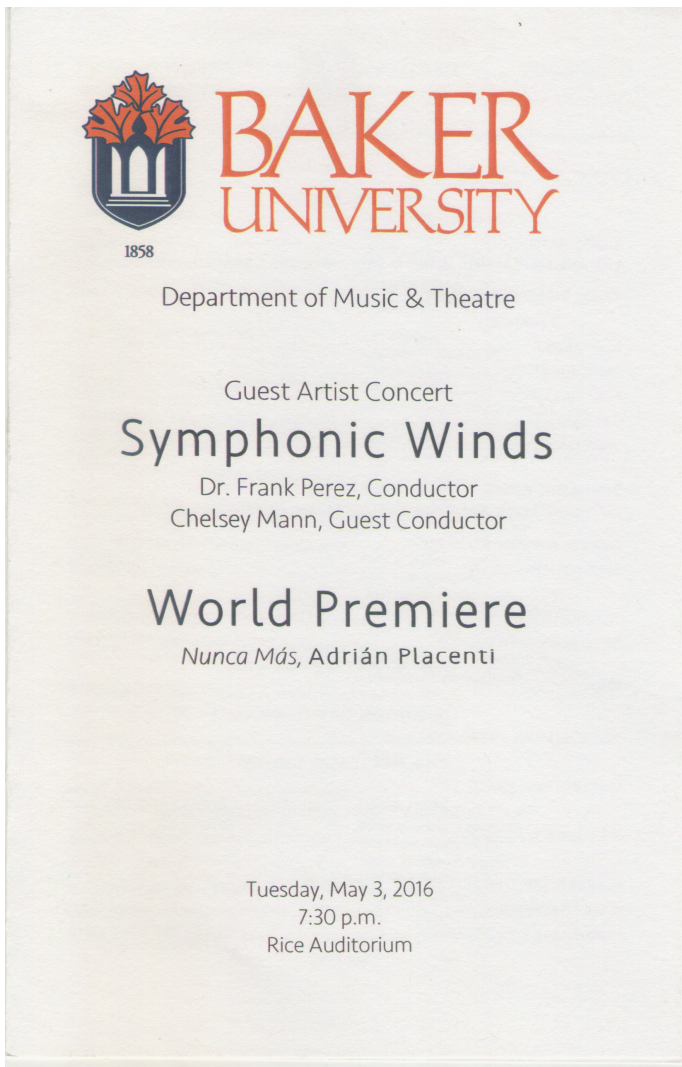
Imagen 9. Portada del Programa del concierto donde se estrenó Nunca más (vendás en los ojos) para Banda Sinfónica del día martes 3 de mayo de 2016, en el Rice Auditorium de la Universidad de Baker