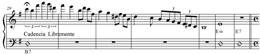
Imagen 2. Cadencia final de parte A

El crescendo lo resolví con la sumatoria de instrumentos y cambios tímbricos. La base armónico-rítmica basada en el compás 3+3+2 se la otorgué a los metales graves (trombones y tuba) y luego se irían agregando las trompetas y trompas. El piano está apoyando todo el tiempo dicha función rítmica y la percusión se iría agregando e incrementando en participación en cada frase para culminar en un acorde de dominante a tutti . A partir de allí comienza una cadencia solista que se la asigné al clarinete. Encontré en el clarinete un sonido cálido y un instrumento lo suficientemente expresivo y maleable como para realizar dicha cadencia que habitualmente la hace el violín. En cuanto a la línea melódica principal el planteo fue el de ir sumando instrumentos (maderas) empezando con lengüetas dobles más una sola flauta.