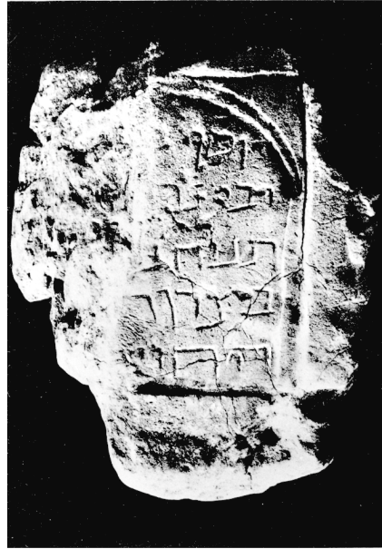
Fig. 2: Inscripción de Yosef , hijo de Rabí Nahman . 45