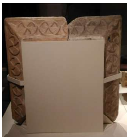
Fig. 6: Cara dorsal de la inscripción de los dos rabinos de Mérida.

Esta pieza presenta una serie de elementos que demuestran cambios importantes durante o después de la conquista islámica de la Península ibérica. Se distingue el uso del latín como lengua epigráfica para las inscripciones funerarias de la época, cuyos cambios paleográficos y gramaticales señalan un latín altomedieval y, por lo tanto, más tardío de las vistas anteriormente.