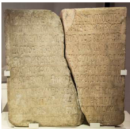
Fig. 5: Cara frontal de la inscripción de los dos rabinos de Mérida.