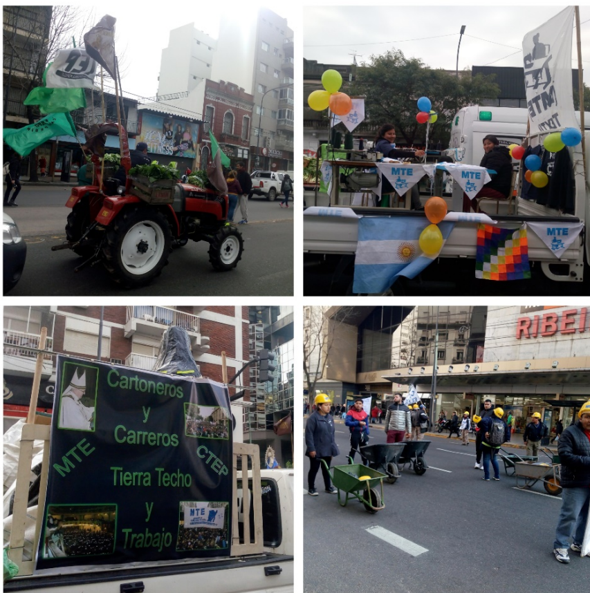
Figura 3. Marchas de San Cayetano.

miembro de la ENOCEP entrevistado) 23 , asociada con pasamontañas, palos y cortes de calles y rutas. Las intervenciones de la CTEP en el espacio público dan cuenta de la importancia del despliegue de la nueva identidad colectiva común, basada en la reivindicación de su condición de trabajadores de la economía popular.