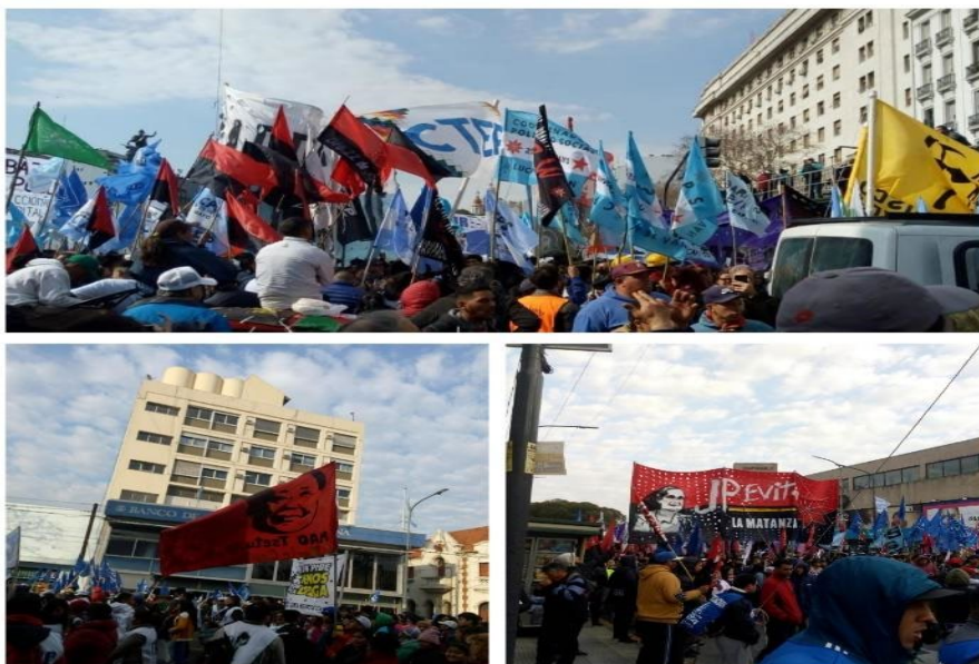
Figura 4. Marcha de San Cayetano, 7 de agosto de 2019.